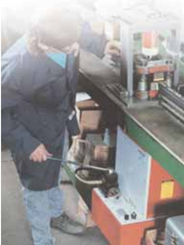
Einsatz in einer hydraulischen Presse.