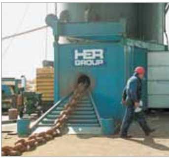
Eine PE4004S-Pumpe und ein RD3006-Zylinder beim Einsatz in einer Spezialpresse zur Reparatur defekter Kettenglieder in der Schiffsbauindustrie.