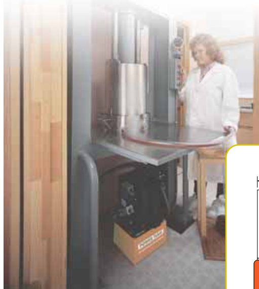
Einsatz einer Pumpe der PE21-Reihe mit einem RD513-Zylinder in einer Spezialpresse zur Gewinnung von Extrakten für homöopathische Medikamente.