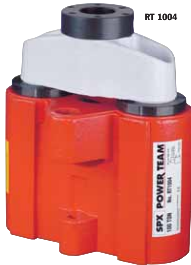
ASME B30.1 700 bar