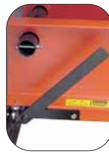
Hebel senkt das Pressenbett zum Pressen und hebt es zum Gleiten.