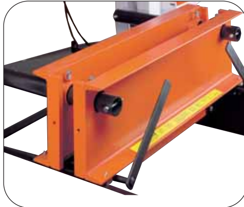
Tiefe zwischen 102 und 686 mm einstellbar; mit Arretierbolzen gesichert.