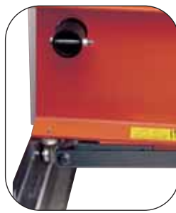
Rollenlager für die sanfte und problemlose Verstellung des Pressenbettes.