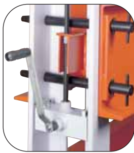
Hubspindel und Arretierbolzen ermöglichen die Höhenverstellung durch nur eine Person.