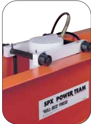
Zylinder problemlos über die Breite des oberen Pressenträgers verschiebbar.