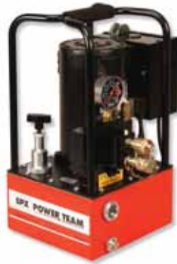
PE30TWP Elektropumpe für Drehmomentschlüssel Siehe Seite 161.